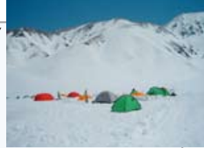
雷鳥沢キャンプ場 雷鳥沢管理所